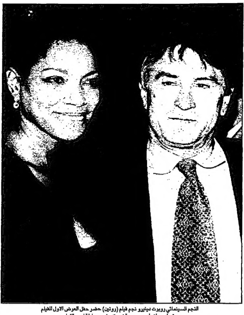
الأميرة سيمينا... 50 سنة سجنأ لأب اغتصب ابنتيه